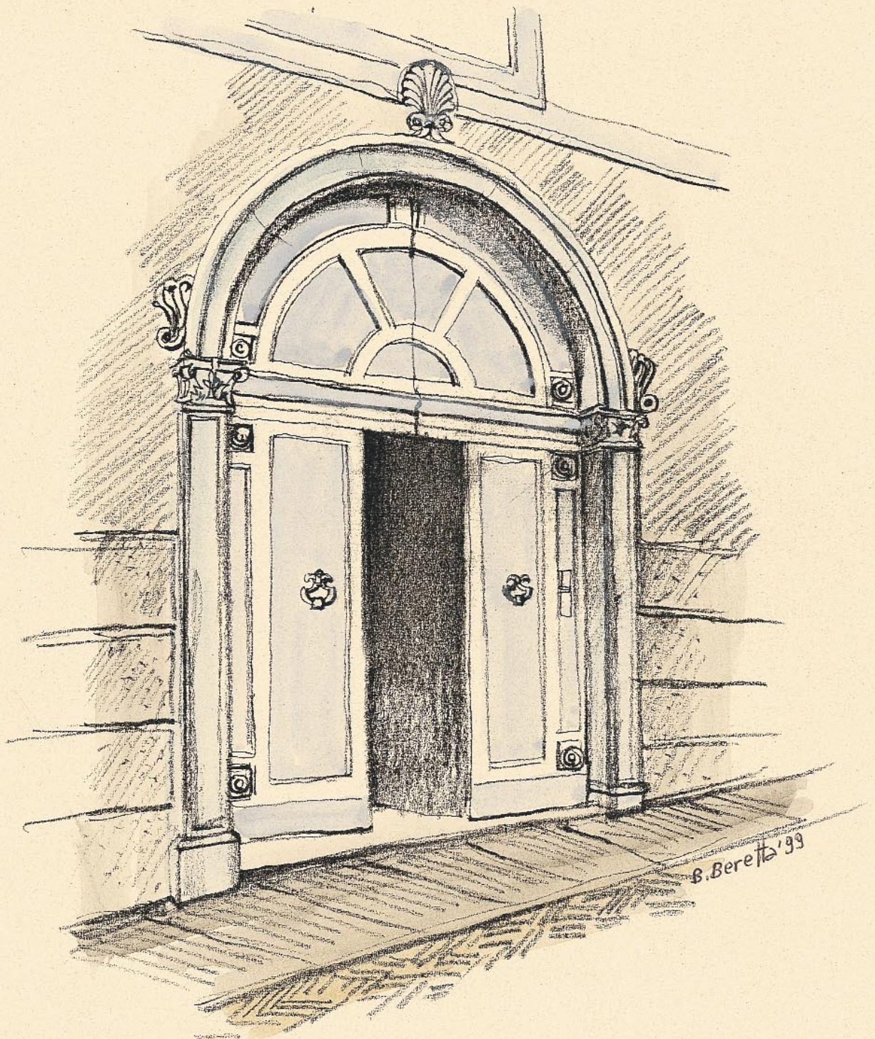
Portale con arco di volta a tutto sesto in via San Lorenzo