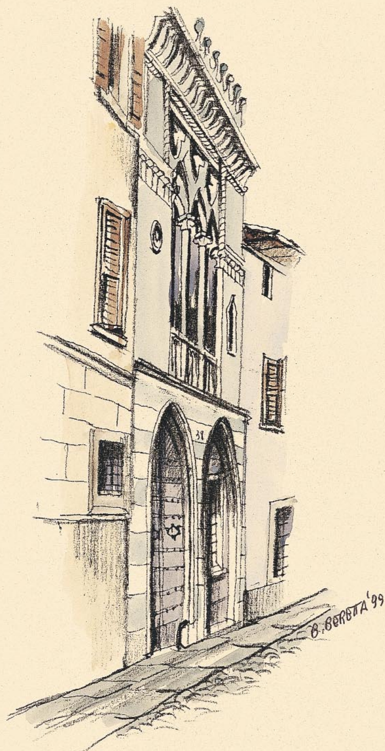
Casa parrocchiale in via Borgo Canale - Portale in pietre artificiali in stile veneziano